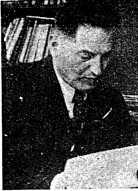
İ. Hakkı Baltacıoğlu

Yeni Adam ilk sayılarından itibaren müstehcen karıştı, pornografi karşıtı bir tutum sergilemiştir. Açık saçık resimler basmayacağını, müstehcen ve romantik edebiyata yer vermeyeceğini ilan etmiştir. 13 Ayrıca çıplaklık ve müstehcenlik ayrımı üzerinde uzun uzadıya durmuş, müstehcenin amaçsız, hayvansı bir sergileme olduğunu oysa sanatta, edebiyatta çıplaklığın idealleştirilmiş bir çıplaklık oldu-