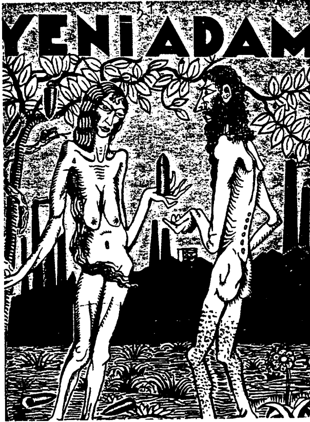
No. 37 (31 Ocak 1935)

Baltacıoğlu'nun çocuk terbiyesine dair düşünceleri ve bunların ulus olma ideolojisiyle bağlantısı daha önceki bir yazıda incelenmişti. 1 Burada ulus